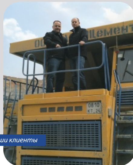
Мы там, где наши клиенты

Главным принципом работы компании является установление доверительных партнерских отношений как с нашими поставщиками, так и с нашими клиентами. «STARCO» предлагает только высококачественную продукцию ведущих мировых производителей и в полной мере поддерживает предоставляемые ими гарантии. Для наших клиентов это означает то, что мы не просто продаем шины – мы вместе с покупателем находим оптимальные решения по выбору и эксплуатации шин для специальной техники.